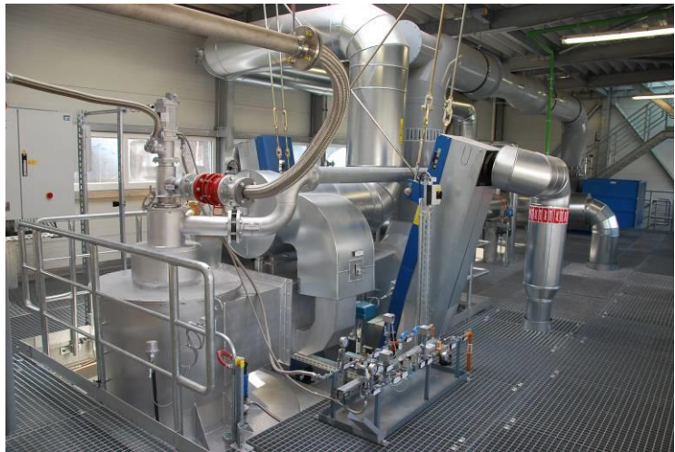
Bild 3 BKS-Brenner

Die SO 2 -Emissionen werden hierbei durch den Einsatz von Kalkhydrat als Additiv zur Rauchgasentschwefelung, das entweder direkt in die Brennkammer oder über ein nachgeschaltetes Verfahren am Kesselende in den Rauchgasstrom eingebracht werden kann, reduziert. Diese verfahrenstechnische Lösung wird beispielsweise bei Braunkohlenstaub aus dem Lausitzer Revier eingesetzt. Bei Braunkohlenstaub aus dem Rheinischen Fördergebiet ist dies jedoch für den oben angegebenen SO 2 -Grenzwert aufgrund des niedrigen Schwefelgehaltes im Brennstoff und der alkalischen Wirkung der Flugasche (Eigeneinbindung von SO 2 durch die Flugasche) nicht erforderlich. Zur Reduzierung der NO x -Emissionen und zur Beeinflussung der Brennraumtemperatur wird der Verbrennungsprozess mit Rauchgasrezirkulation und Verbrennungsluftstufung betrieben.