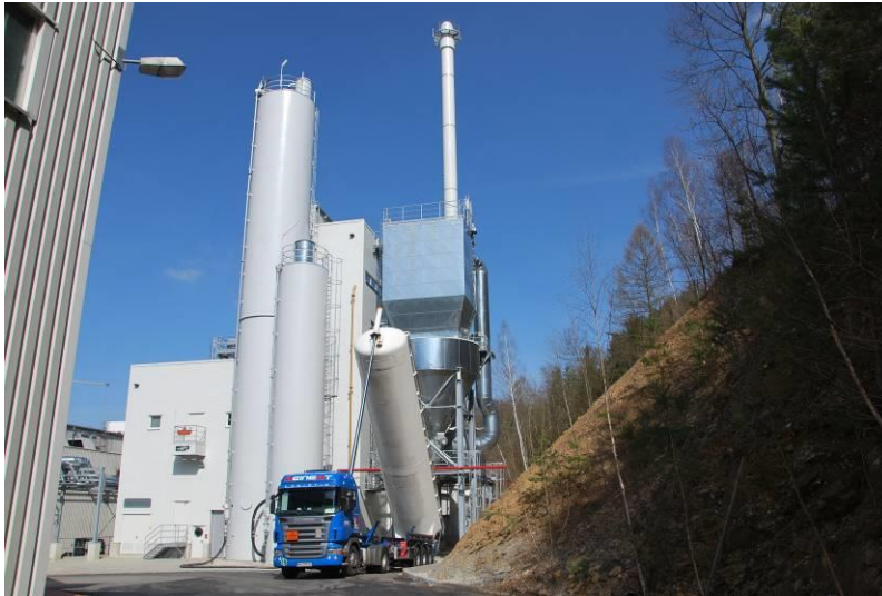
Bild 2 Brennstoffanlieferung

Der mit speziellen Tankfahrzeugen zum Bestimmungsort gelieferte Braunkohlenstaub gelangt – wie in Bild 2 dargestellt – mittels pneumatischer Förderung vom Tankfahrzeug in das Brennstoffsilo. Die bei der Verbrennung anfallenden Reststoffe (Asche, Additiv zur Schwefeleinbindung) können je nach Anfall mit dem gleichen Tankfahrzeug zur Entsorgung mitgenommen werden. Damit ist ein geschlossener Stoffkreislauf von Brennstoff und Reststoffen gesichert.