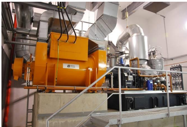
Bild 5 Gegendruck-Dampfturbinenanlage

Beispielhaft ist in Bild 4 das BKS-Heizkraftwerk einer Papierfabrik dargestellt. Der im BKS-Kessel erzeugte Heißdampf entspannt nach der Durchströmung der Gegendruck-Dampfturbine (Bild 5) auf den Betriebsdruck des Dampfnetzes der Papiermaschine und wird anschließend im technologischen Prozeß der Papierherstellung kondensiert. Die erzeugte Elektroenergie dient zur Eigenversorgung der Papierfabrik und des Heizkraftwerkes. Im BKS-Kessel wird neben dem Hauptbrennstoff auch Biogas aus der betrieblichen Kläranlage mitverbrannt.